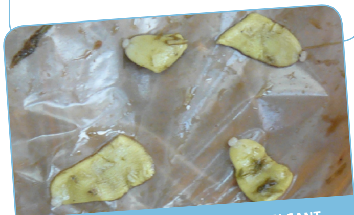
SEGMENTS DE TÉNIA ADULTE SUR UN GANT

Parlez à votre vétérinaire de la gestion de vos locaux et prairies. Idéalement, révisez le système chaque année, en particulier s'il y a des changements majeurs dans la gestion des pâtures.