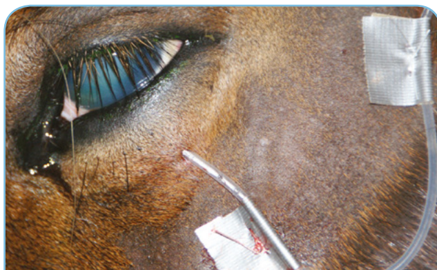
UNE CORNÉE ENFLAMMÉE AVEC UN CATHÉTER SOUS PALPÉBRAL À TRAVERS LA PAUPIÈRE INFÉRIEURE

Dans le cas où l'administration des collyres est très compliquée en raison de la douleur et/ou du comportement du cheval, un cathéter sous palpébral peut être mis en place. Il s'agit d'un fin tuyau qui permet d'amener les collyres à la surface de l'œil depuis la zone du garrot et ainsi d'administrer les traitements sans avoir à toucher la tête du cheval.