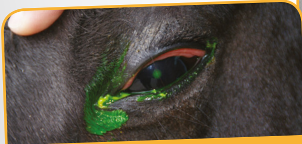
UN ULCÈRE CORNÉEN SE COLORE EN VERT SUITE À L'INSTILLATION DE FLUORESCÉINE

La plupart des situations rentrent facilement dans l'ordre avec un traitement, cependant, une blessure oculaire qui ne serait pas traitée à temps peut prendre une tournure grave, qui peut mener jusqu'à la perte de vision.