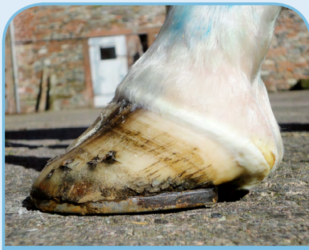
MAUVAISE CONFORMATION DU PIED PRÉDISPOSANT LE CHEVAL A DÉVELOPPER DES BLEIMES