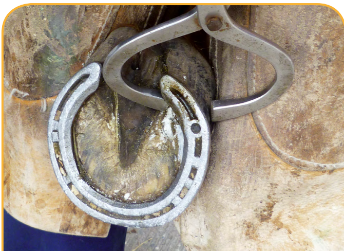
DOULEUR À LA PRESSION DE LA PINCE À SONDER SUR LA ZONE AFFECTÉE