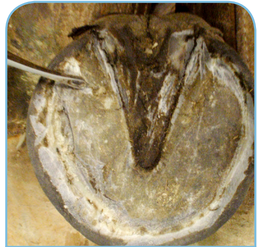
DÉGAGEMENT D'UNE BLEIME