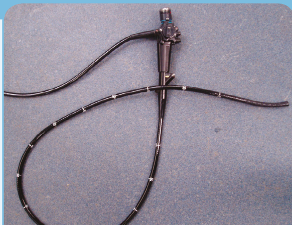
ENDOSCOPE - IL PEUT ÊTRE INTRODUIT PAR LE NASEAU DE VOTRE CHEVAL JUSQU'À LA TRACHÉE AFIN D'AIDER AU DIAGNOSTIC DE L'ASTHME ÉQUIN.