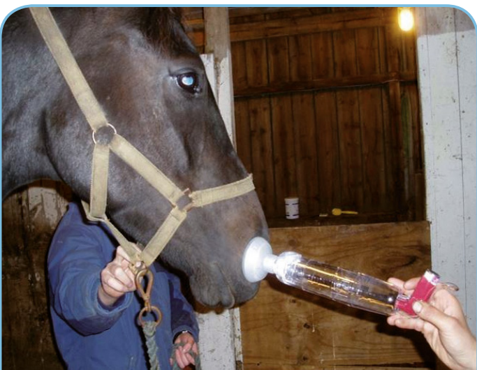
UTILISATION D'UN INHALATEUR ÉQUIN