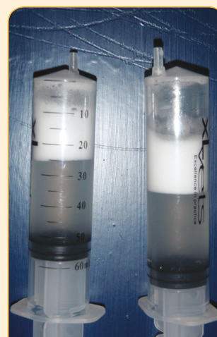
FIGURE 2 : LIQUIDE DE PRÉLÈVEMENT PULMONAIRE

Photo de l'intérieur de la trachée avant l'entrée du poumon. Des gouttes de mucus plus claires sont visibles en bas de l'image.